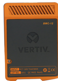
单体电池检测模块